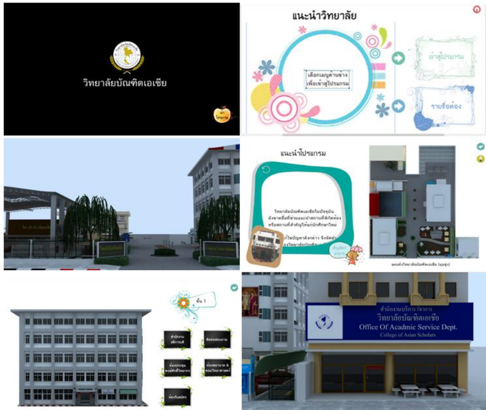
รูปที่ 7 ตัวอย่างสื่อนำเสนอ