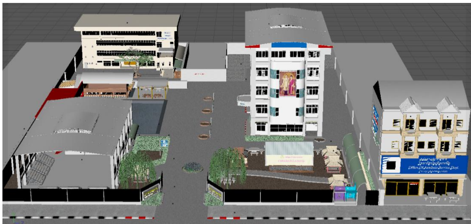
รูปที่ 6 แบบจำลองวิทยาลัยบัณฑิตเอเชีย