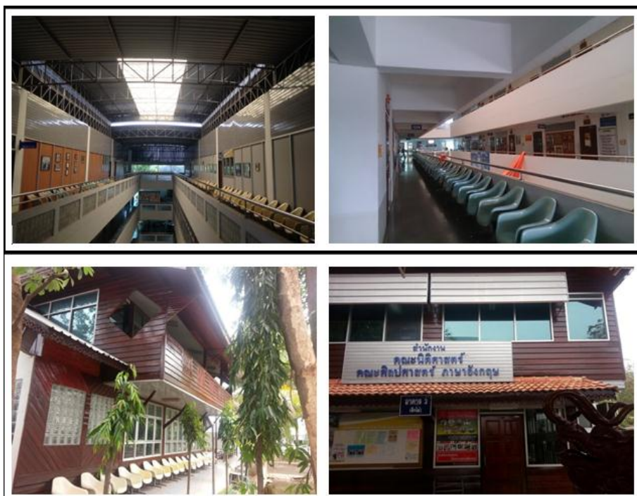
รูปที่ 2 ตัวอย่างภาพถ่ายอาคาร และห้องสำนักงานต่างๆ