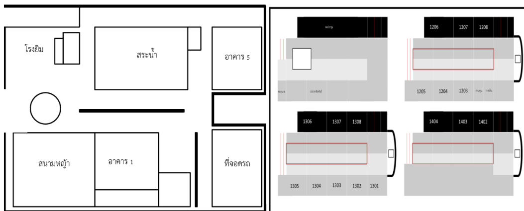
รูปที่ 3 ตัวอย่างแผนผังวิทยาลัย และอาคาร

จากภาพถ่ายและข้อมูลที่ผู้วิจัยได้ศึกษาองค์ประกอบของพื้นที่ ห้อง และ อาคาร สร้างเป็นแผนผังวิทยาลัย และ แผนผังอาคาร เพื่อนำไปสู่การขึ้นรูปแบบจำลอง 3 มิติ ดังแสดงในรูปที่ 3