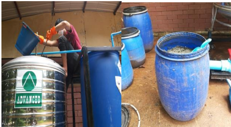
ภาพที่ 1. การเติมเศษอาหารผสมกับมูลวัวในระบบเพื่อทดสอบ

การดำเนินงานนั้นได้เตรียมวัสดุอุปกรณ์และทดลองเพื่อศึกษาการวิจัย