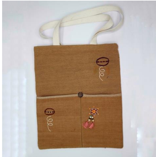
ภาพที่ 2 กระเป๋าผ้าฝ้ายทอมือย้อมสีจากเปลือกพะยอม ปักลายด้วยมือ ลายบังไฟตะไลล้านและลายมาลัยไม้ไผ่