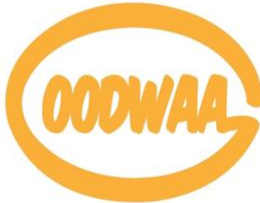
ภาพที่ 3 ตราผลิตภัณฑ์ที่ได้รับการจดอนุสิทธิบัตร

จากการผลิตผลิตภัณฑ์ที่มีมูลค่าของกลุ่มพัฒนาอาชีพสตรีบ้านกุดหว้าจังหวัดกาฬสินธุ์ สมาชิกเป็นสุภาพสตรีชาวผู้ไททั้งหมด จำนวน 40 คน ได้รวมกลุ่มกันทำกิจกรรมในเวลาว่างเพื่อเป็นการสร้างรายได้เสริมจากอาชีพหลัก ทำให้มีรายได้เพิ่มขึ้นจากเดิม และจัดประชุมกลุ่มเพื่อพัฒนาตราสินค้าและบรรจุภัณฑ์ของชุมชนโดยผลการประชุมพบว่าตราสินค้าที่จัดทำขึ้นนั้นมาจากชื่อของหมู่บ้าน ที่สามารถจดจำได้ง่าย มีการจดอนุสิทธิบัตรภายใต้แบรนด์ที่ชื่อว่า GOODWAA ซึ่งแสดงให้เห็นถึงตราสินค้าและบรรจุภัณฑ์ที่ได้รับการพัฒนาแล้วสามารถนำไปใช้เชิงพาณิชย์ได้ และมีการอบรมเชิงปฏิบัติการกลยุทธ์การตลาด E – Commerce (Shopee/Lazada) เรื่องระบบการขายสินค้าผ่าน (Shopee/Lazada) และการใช้งานระบบ Seller Center ตลอดจนเทคนิคการปิดการขายสินค้าบนตลาดออนไลน์