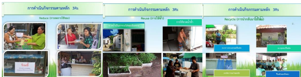
ภาพที่ 4 กิจกรรม 3 R s

ตั้งนั้นภาวะผู้นำแบบร่วมสมัยของผู้นำชุมชนที่มีผลต่อการลดขยะต้นทางโดยใช้แนวคิด 3Rs ประกอบด้วย 5 องค์ประกอบได้แก่ คุณลักษณะการเป็นผู้นำการเปลี่ยนแปลง การใช้กระบวนการมีส่วนร่วม นักจิตอาสา การสร้างทีม การบริหารความขัดแย้งโดยใช้ศาสตร์และศิลป์ ส่งผลให้เกิดการพึ่งพาตนเองในการจัดการขยะของชุมชน เกิดสิ่งแวดล้อมที่ดี สร้างวัฒนธรรมชุมชนปลอดขยะ เป็นต้นแบบและศูนย์การเรียนรู้ด้านการจัดการขยะ และมีพลังทางสังคมในการขยายผลการดำเนินการด้านการจัดการขยะให้กับชุมชนอื่น สำหรับปัจจัยความสำเร็จของชุมชนหัวถนน ได้แก่ ระยะเวลาการพัฒนา 2556 - 2557-2558 จำนวนประชากร จำนวนประเภทแหล่งกำเนิดขยะ คนในชุมชนส่วนใหญ่เป็นคนในพื้นที่ ทำให้สร้างการมีส่วนร่วมได้อย่างต่อเนื่อง