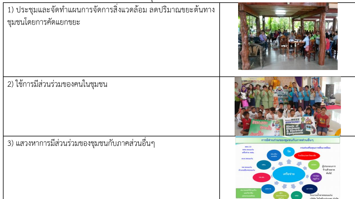
ตารางที่ 3 กระบวนการลดขยะต้นทาง โดยใช้ 3Rs ชุมชนบ้านหัวถนน ตำบลพระลับ อำเภอเมือง จังหวัดขอนแก่น

การจัดการขยะมูลฝอย ของชุมชนจากต้นทาง ยังใช้วัฒนธรรมชุมชนปลอดขยะการลด ใช้ซ้ำ และการนำกลับมาใช้ใหม่ (3R) อย่างต่อเนื่อง ตามวิสัยทัศน์ของชุมชนที่ว่า “บ้านหัวถนนหมู่บ้านเข้มแข็ง ชาวบ้านอยู่ดีมีสุข ใช้ชีวิตพอเพียง สิ่งแวดล้อมสะอาดสวยงาม ปราศจากมลพิษ รักษาจารีต” ซึ่งสะท้อนให้เห็นกระบวนการจัดการขยะต้นทางอย่างต่อเนื่อง ดังนี้