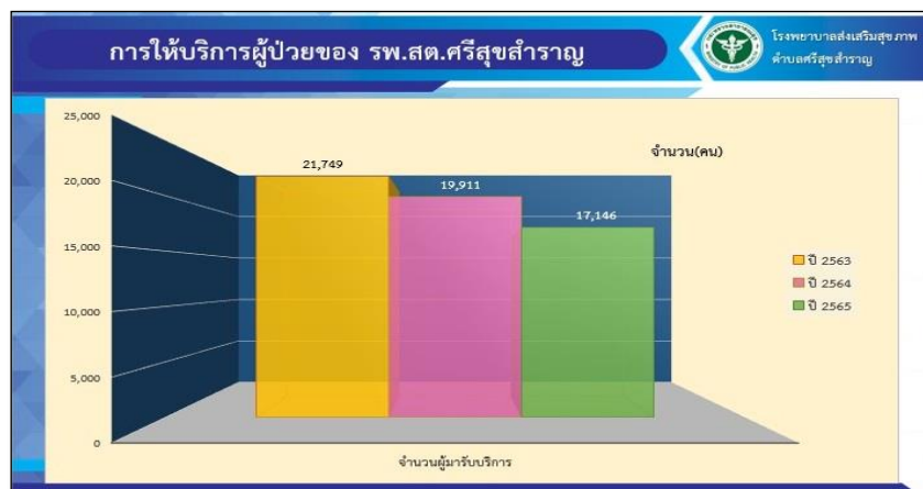
ภาพที่ 1 แสดงการให้บริการผู้ป่วยของ โรงพยาบาลส่งเสริมสุขภาพตำบลศรีสุขสำราญ

จากรายงานการเข้ารับบริการโรงพยาบาลส่งเสริมสุขภาพตำบลศรีสุขสำราญ อำเภออุบลรัตน์ จังหวัดขอนแก่น ระหว่างปี 2563 – 2565 พบว่า โรงพยาบาลส่งเสริมสุขภาพตำบลศรีสุขสำราญ มีการใช้บริการลดน้อยลง จากข้อมูลเบื้องต้น ระยะเวลาทำการของโรงพยาบาลส่งเสริมสุขภาพตำบลศรีสุขสำราญให้บริการตั้งแต่เวลา 8:30 น ถึง 20.30 น . ของทุกวัน