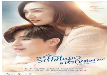
ภาพที่ 2 นางเอกกับพระเอก

ละครโทรทัศน์เรื่องนี้ ได้แสดงภาพวิถีชีวิตความเป็นอยู่ของนางเอกที่อยู่ตัวคนเดียวในบ้านทันสมัย ถือเป็นผู้หญิงยุคใหม่ที่พึ่งพิงตัวเองได้ ดังตัวอย่างภาพจากละครโทรทัศน์ต่อไปนี้