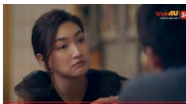
ภาพที่ 11 นางเอกพูดกับพระเอกเรื่องความรัก

จากการวิเคราะห์ละครทั้งสองเรื่องเกี่ยวกับทัศนคติเรื่องการแต่งงานของผู้หญิง ผู้วิจัยพบว่าทัศนคติเกี่ยวกับความจำเป็นต้องการแต่งงานหรือไม่สำหรับสตรีในละครเรื่อง รักใช้ไหมที่หัวใจต้องการของไทยกับละครเรื่อง 下一站是幸福 (Find Yourself) ของจีน มีความแตกต่างกัน สังคมไทยกับจีนกำลังอยู่ในช่วงเปลี่ยนแปลง ดังนั้น ความคิด ค่านิยม และโลกทัศน์ก็เปลี่ยนแปลงไปตามสิ่งแวดล้อม จึงทำให้สตรีไทยกับสตรีจีนมีทัศนคติเกี่ยวกับความจำเป็นต้องการแต่งงานเปลี่ยนแปลงด้วย นางเอกทั้งไทยและจีนต่างมีทัศนคติไม่ใช่เรื่องจำเป็นที่ต้องที่ผู้หญิงจะต้องแต่งงาน เพราะว่าอยู่คนเดียวสบายมากกว่า เช่น ตัวอย่างดังต่อไปนี้