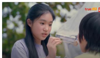
ภาพที่ 7 นางเอกดูแลพระเอกเมื่อตอนเด็ก

ละครเรื่อง รักไข่มุขที่หัวใจต้องการ ของไทย ตัวละครเอกหญิงกับตัวละครเอกชายมีอายุห่างกัน 6 ปี ตัวละครเอกหญิงเคยเป็นที่เลี้ยงเมื่อ 17 ปีก่อนของตัวละครเอกชาย เมื่อพวกเขาพบกันอีกครั้ง นางเอกลืมนางเอกไปแล้วแต่พระเอกจำนางเอกได้ตลอดมาและตั้งใจที่จะมาหาเธอ เขาจำสัญญาของเขาว่าต้องกลับมาหาเธอและให้เธอมีความสุข เมื่อพระเอกกลับมาเมืองไทยอีก นางเอกไม่รู้จักเขาและคิดว่าเขาเป็นผู้ชายที่หน้าตาดีอย่างเดียว