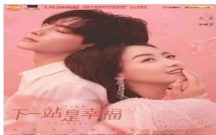
ภาพที่ 4 นางเอกจีนกับพระเอกจีน