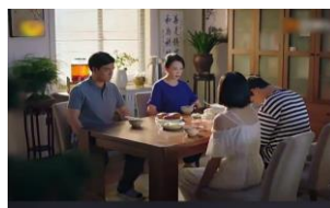
ภาพที่ 5 ครอบครัวของนางเอกจีน

จากภาพที่ 4 นางเอกจีนอยู่กับพ่อแม่ กินอาหารเข้าด้วยกัน นางเอกเป็นคนอิสระไม่มากนักน้องชายของนางเอกชื่อเหอชานหยาง เขาเลิกกับแฟนและเปลี่ยนแฟนได้อย่างง่าย พ่อแม่ก็ดูเขาและคิดว่าเขาเจ้าชู้ ไม่รับผิดชอบแก่ผู้หญิง ตอนรับประทานอาหารเช้าของเหอชานชิงเสนอให้เหอชาน หยางย้ายไปพักที่หอพักของมหาวิทยาลัย ไม่อยากยุ่งกับเรื่องส่วนตัวของเขา