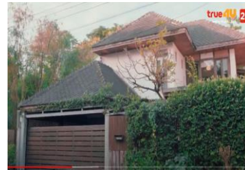
ภาพที่ 3 สภาพบ้านของนางเอก

ภาพจากเรื่อง รักใช้ไหมที่หัวใจต้องการ ในตอนที่ 4 ละครได้แสดงภาพขณะที่นางเอกกำลังโทรศัพท์คุยกับแม่ ผู้ชมละครจะเห็นลักษณะบ้านเรือนที่อยู่อาศัยของนางเอกว่ามีบ้านสองชั้น มีลานปลูกดอกไม้และเป็นบ้านส่วนตัว ซึ่งสภาพวิถีชีวิตของนางเอกด้านบ้านเรือนที่อยู่อาศัยเป็นบ้านของคนมีฐานะดี