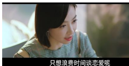
ภาพที่ 12 นางเอกพูดไม่ยอมแต่งงาน

นางเอกไปพบผู้ชายที่พ่อแม่ทำให้ พูดว่าเธอไม่ยอมแต่งงานแต่อยากมีความรักและเกี่ยวข้องกับคู่รักผู้ชายคนนั้นยอมรับไม่ได้ เขาพูดว่าเธออายุมากแล้ว เลิกมากทำไม นางเอกไม่เชื่อผู้หญิงสามสิบกว่าต้องแต่งงาน เธอเชื่อต้องการมีความรักแท้ ไม่จำเป็นต้องการแต่งงานและมีครอบครัว เธออยากเป็นผู้หญิงที่เข้มแข็ง