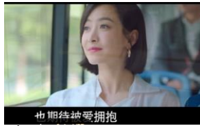
ภาพที่ 10 นางเอกหลังนัดพบกับผู้ชาย

จากตัวอย่างที่ดังกล่าวว่าในประเทศไทยเรื่อง รักไข่มุขที่หัวใจต้องการ ได้เห็นว่านางเอกเมื่อคบกับผู้ชาย เธอถูกทิ้งทุกครั้ง เธอไม่เข้าใจเหตุผลที่ถูกทิ้ง ซึ่งนางเอกมีทัศนคติเกี่ยวกับการเลือกคู่ คืออยากมีคู่รักที่เป็นความรักแท้ๆ แต่ถ้าไม่ใช่คนที่เหมาะสมกับเธอ เธอก็ยอมรับด้วยการเลิกรักกันและจบลง การเลือกคู่รักของตัวเองจึงต้องเป็นคนที่เธอต้องการจริงๆ และเป็นคู่ครองที่ได้แต่งงานกัน มิใช่เพียงคบกันชั่วคราว