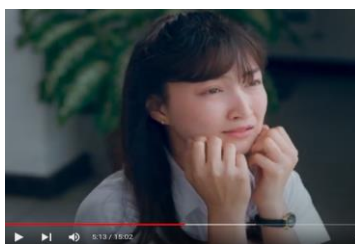
ภาพที่ 6 นางเอกใส่ชุดนักศึกษา

ละครเรื่อง รักใช้ไหมที่หัวใจต้องการ ของไทย นอกจากจะให้เห็นสภาพวิถีชีวิตของตัวละครเอกหญิงว่าเป็นผู้หญิงไทย พูดภาษาไทย และมีวัฒนธรรมประเพณีไทย ๆ บ้านเรือนของตัวละครเอกเป็นวิลล่าเป็นบ้านส่วนตัวอยู่คนเดียวแล้ว ในละครไทยเรื่องนี้ยังแสดงให้เห็นว่าตัวละครเอกหญิงจบการศึกษาระดับปริญญาตรี เพราะมีฉากที่แสดงให้เห็นชีวิตของตัวละครเอกหญิงในช่วงมหาวิทยาลัย มีรุ่นพี่ที่เล่นดนตรีเคยเป็นคู่รักกับนางเอก ฉากที่ปรากฏออกมาแสดงให้เห็นว่าตัวละครเอกหญิงมีการศึกษาระดับสูง เป็นผู้หญิงที่มีแนวคิดใหม่ ทันสมัย และมีความสามารถทางการศึกษา