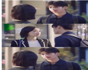
ภาพที่ 8 พระเอกเป็นเด็กฝึกงาน

ละครเรื่อง 下一站是幸福 (Find Yourself) ของจีน ตัวละครเอกหญิงชื่อเหอพานซิง สาวโสดอายุ 32 พระเอกเป็นหนุ่มโสดหน้าตาดีที่เป็นเด็กฝึกงานในบริษัทของเธอ เขาอายุน้อยกว่าเธอ 10 ปี แม่เธอจะพอใจเขามาก แต่เธอก็กังวลว่าความรักระหว่างเธอกับหยวนซ่งอาจจะไปด้วยกันไม่ได้ เธอจึงลังเลและสงสัยว่าความรักกับพระเอกจะเหมาะสมหรือไม่ นอกจากนั้นเธอยังกังวลว่าครอบครัวเธอจะตำหนิเธอหรือไม่ที่เธอมีคู่รักอายุน้อยกว่ามาก