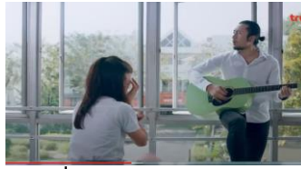
ภาพที่ 9 นางเอกถูกคู่รักบอกเลิก

จากตัวอย่างที่ดังกล่าวว่าในประเทศไทยเรื่อง รักไข่มุขที่หัวใจต้องการ ได้เห็นว่านางเอกเมื่อคบกับผู้ชาย เธอถูกทิ้งทุกครั้ง เธอไม่เข้าใจเหตุผลที่ถูกทิ้ง ซึ่งนางเอกมีทัศนคติเกี่ยวกับการเลือกคู่ คืออยากมีคู่รักที่เป็นความรักแท้ๆ แต่ถ้าไม่ใช่คนที่เหมาะสมกับเธอ เธอก็ยอมรับด้วยการเลิกรักกันและจบลง การเลือกคู่รักของตัวเองจึงต้องเป็นคนที่เธอต้องการจริงๆ และเป็นคู่ครองที่ได้แต่งงานกัน มิใช่เพียงคบกันชั่วคราว