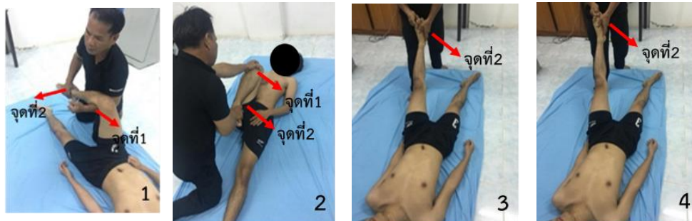
ภาพที่ 2 การนวดจัดกระดูกข้อเข่า (ช่วงที่สอง) 1 การนวดจัดกระดูกในชั้นตอนที่ 5

ชั้นตอนที่ 8 จากนั้นหมอยกขาของผู้ป่วยขึ้นในลักษณะเหยียดตรง หมอใช้มือประคองที่ข้อเท้าส่วนมืออีกข้างทำการดึงนิ้วเท้าทั้ง 5 นิ้ว ทำทั้ง 2 ข้าง ประโยชน์ เป็นการยืดกล้ามเนื้อ กระดูกข้อเท้า และลดอาการปวดเข่าได้ ดังแสดงในภาพที่ 2