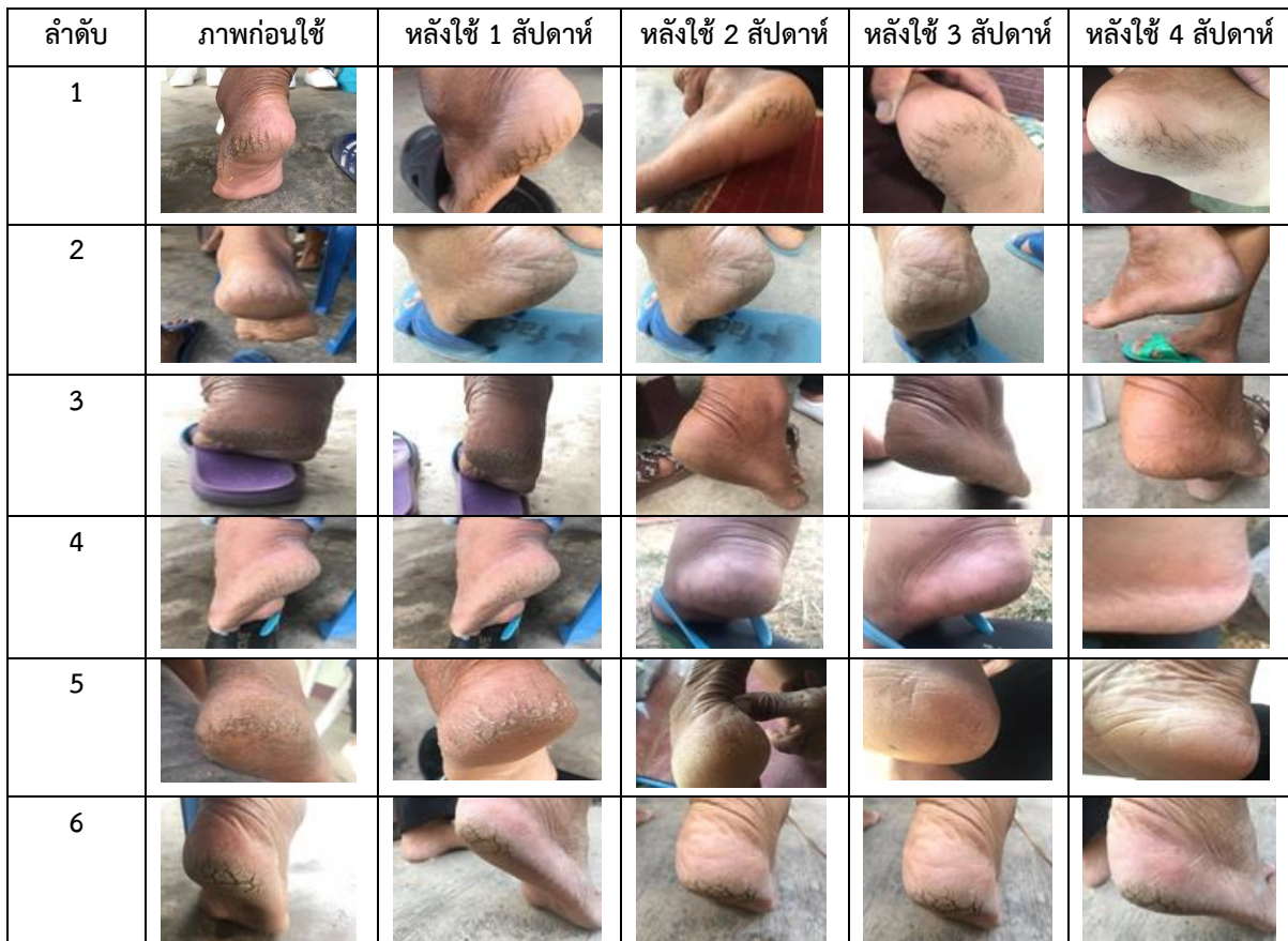
ตารางที่ 2 แสดงการเก็บข้อมูลและเปรียบเทียบก่อนใช้ผลิตภัณฑ์ช่วงสัปดาห์ที่ 1 ถึงหลังใช้สัปดาห์ที่ 4 ณ บ้านชำแฮด หมู่ 9

จากการศึกษา พบว่า ความพึงพอใจในการใช้ผลิตภัณฑ์ลดอาการคันเท้าแตกกลายจากมันแกว และสมุนไพรธรรมชาติโดยรวมอยู่ในระดับชอบมาก ( \bar{x} = 4.09 , S.D. = 0.67) เมื่อพิจารณาเป็นรายข้อพบว่าข้อที่ได้รับความพึงพอใจมากที่สุด คือ ความพึงพอใจที่นำมันแกวมารับเป็นผลิตภัณฑ์ครีม ( \bar{x} = 4.49 , S.D. = 0.63 ) รองลงมา คือ รูปลักษณะภายนอกของผลิตภัณฑ์ ความชอบจากการสัมผัสเนื้อครีม ( \bar{x} = 4.14 , S.D. = 0.73 ) และชอบน้อยที่สุด คือ ประสิทธิภาพหลังใช้ผลิตภัณฑ์ใน 4 สัปดาห์ ( \bar{x} = 3.87 , S.D. = 0.72 )